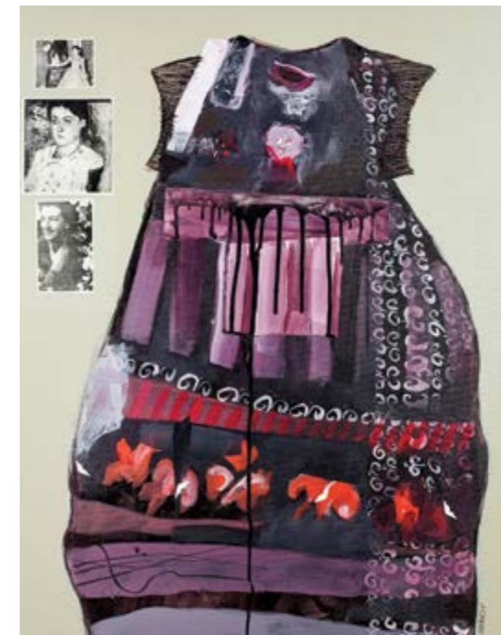
DRESS HOME | 2014 Tecnica mista su tela cm 94 x 72