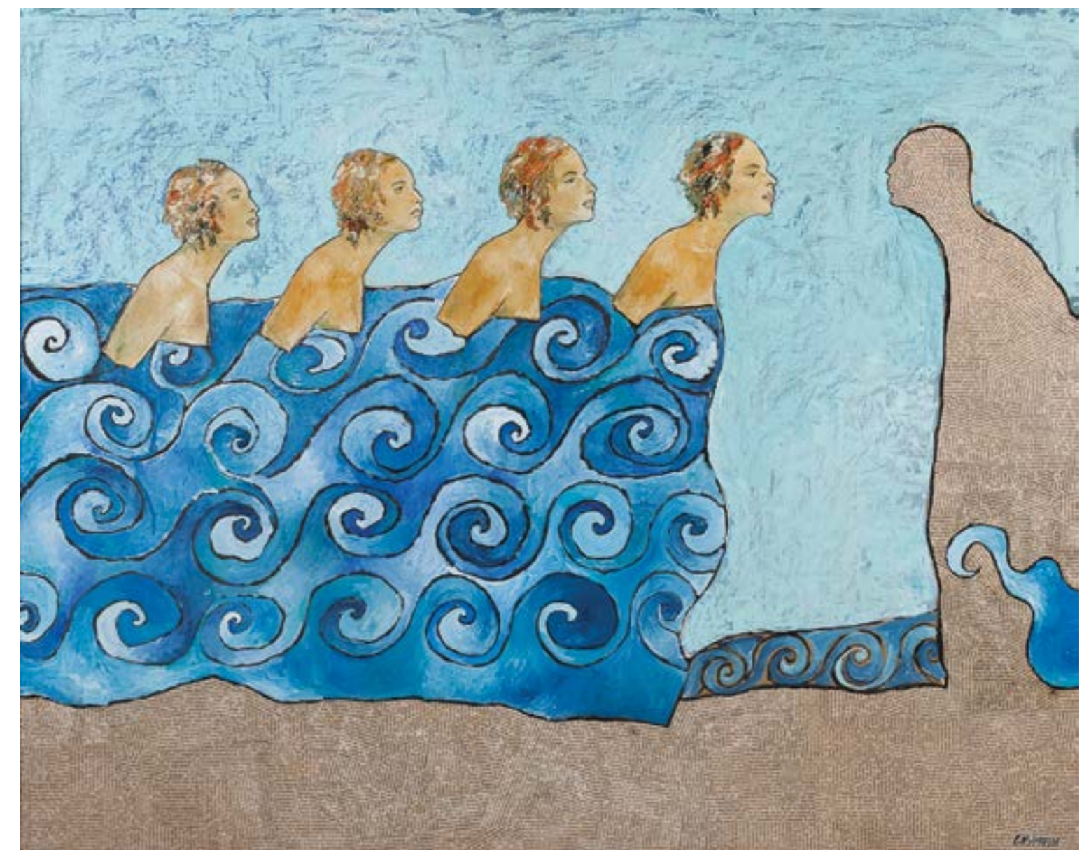
CONTROCORRENTE | 2009 Olio e collage cm 80 x 110

vive e lavora a Thiene (VI) www.lucianogasparin.com