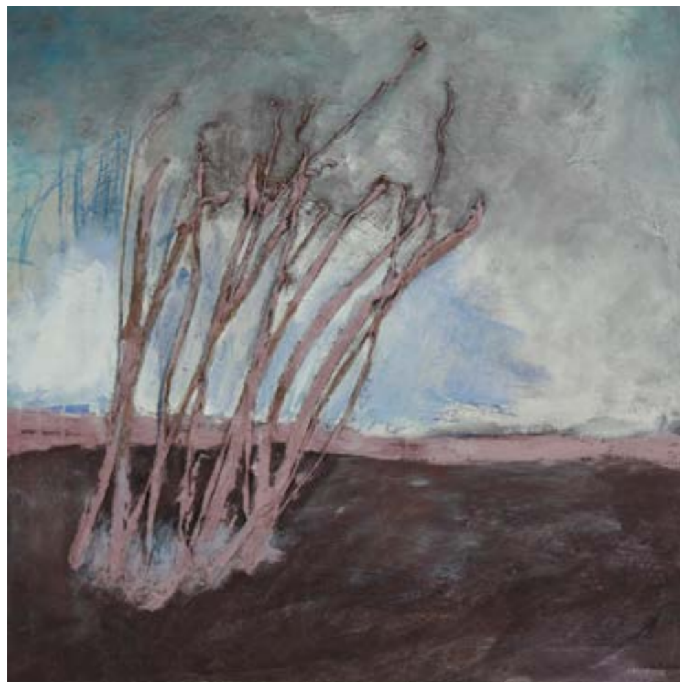
ROVI NEL VENTO | 2015 Tecnica mista su tela cm 90 x 90

modo disomogeneo così da creare un effetto simile a una combustione. I tronchi stilizzati di queste alberature sono realizzati con carta di giornale e collage creando un ideale contrasto tra la tematica legata al mondo naturale e la sua realizzazione tramite materiale di scarto.