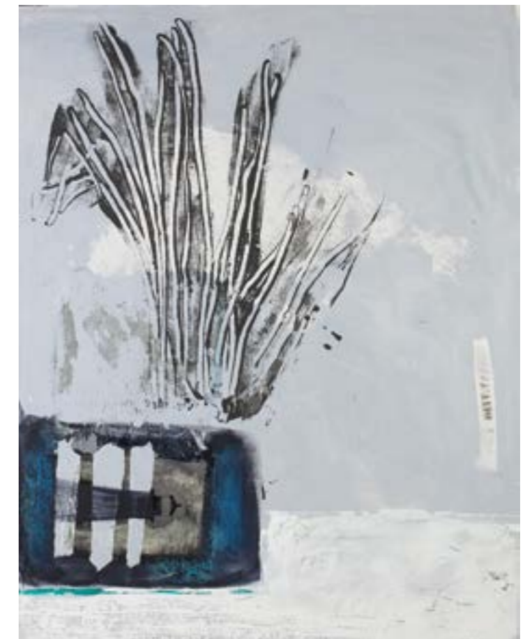
DECOMPOSIZIONE FLOREALE | 2012 Tecniche sperimentali cm 72 x 93