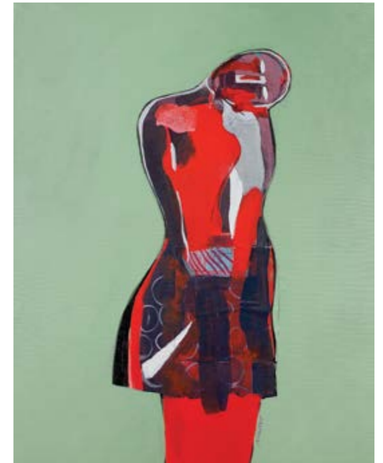
ZOE' | 2014 Tecnica mista su tela cm 94 x 72

In ciascuna di queste varianti (solo alcuni tra i mille volti del-