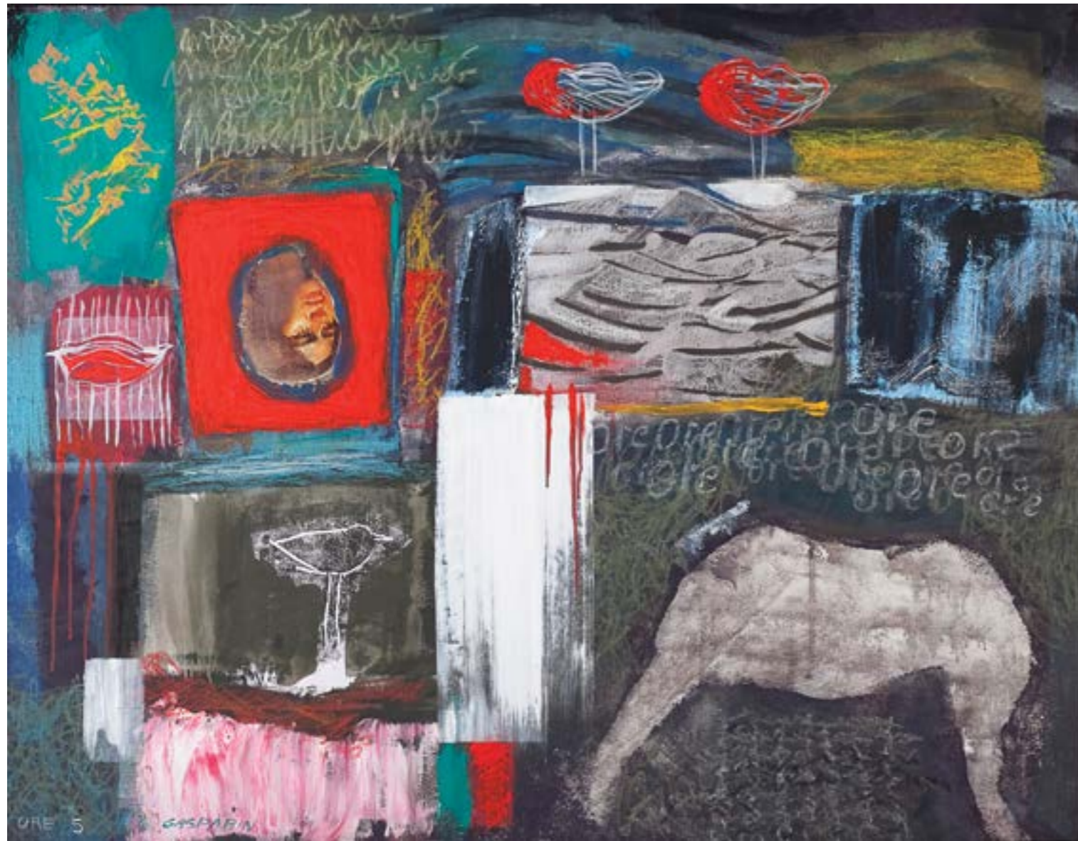
ORE 5 | 2012 Tecniche sperimentali cm 72 x 93